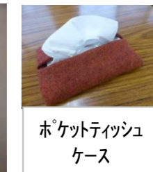
ポケットティッシュケース